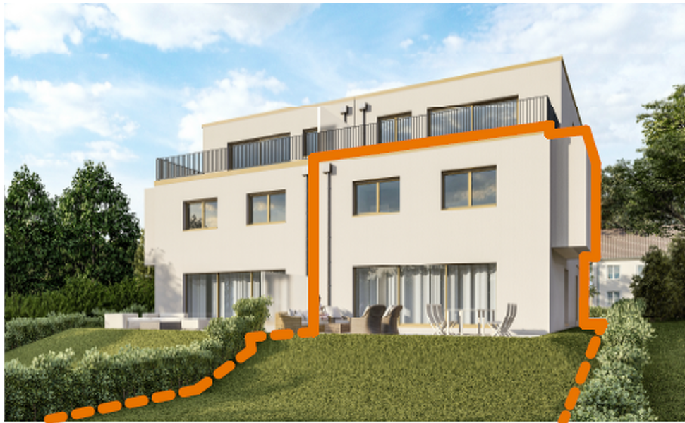
VUE DU JARDIN