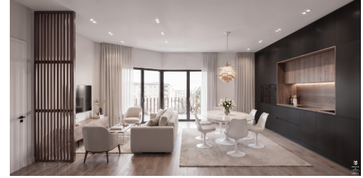
ETAGE 3 APPARTEMENT 7